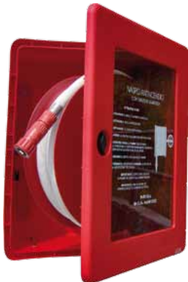
NASPO F1 in plastica