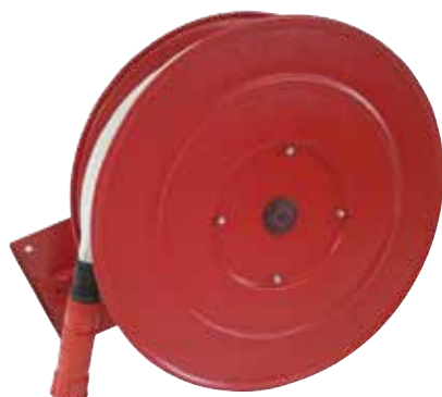
NASPO A PARETE orientabile